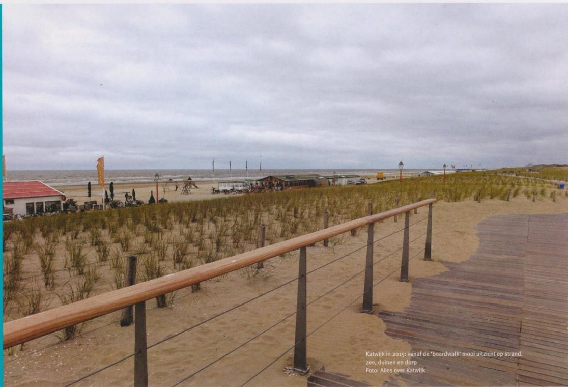
Katwijk in 2015: vanaf de 'boardwalk' mooi uitzicht op strand, zee, duinen en dorp

KUST ZUID-HOLLAND VEILIG VOOR DE TOEKOMST