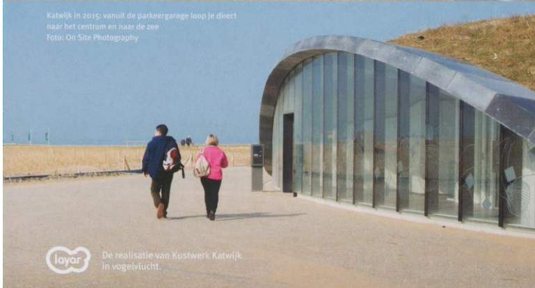
Katwijk in 2015: vanuit de parkeergarage loop je direct naar het centrum en naar de zee.